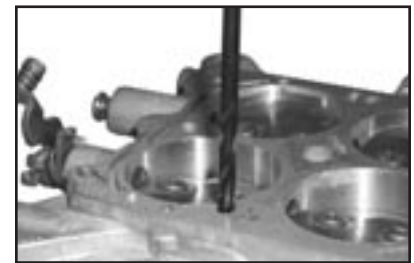
Figure 1B Figure 1B Figure 1B