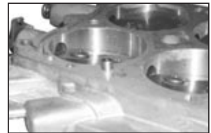
Figure 1C Figure 1C Figure 1C