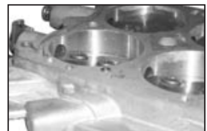
Figure 1D Figure 1D Figure 1D